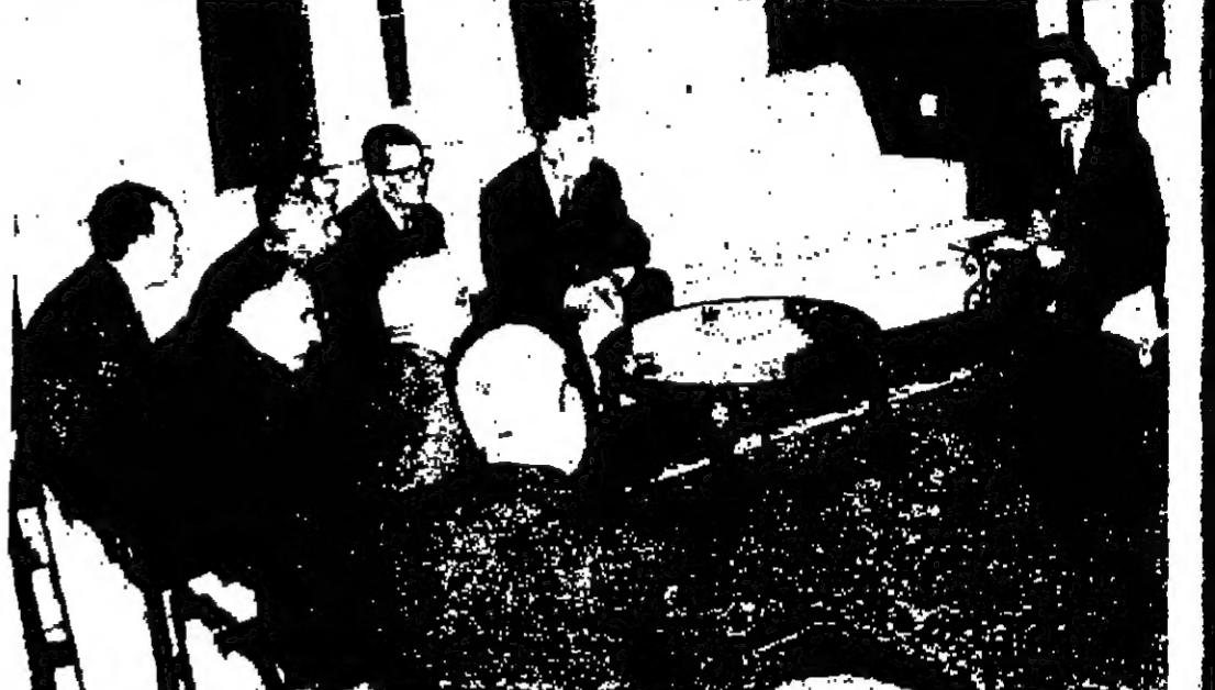
سور الجبر حسن ولي المهدي نائب جلالة الملك العظيم يتحدث الى أعضاء الوفد البلغاري لدى نشرهم بقبلة سيوه امس

القدس المحتلة - سلام وقد يكون من ست شخصيات من الشخصيات الفلسطينية العربية الكيرة في مدينة القدس العربية والضفة الغربية من الأردن - مذكرة - جديدة الى الجرائل اود هول كير المرأتين التولين اخبروا انها عن تقديم الخطوات الدبلوماسية العربية في الامم المتحدة الخاتمة بلطوح القانوني لجنة القدس وقد وقع على هذه المذكرة السيد جالب التخصيمت كات من المواطنين العرب في الضفة الغربية من الأردن .